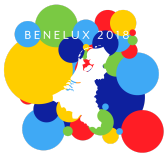
Table de matières / Inhoudsopgave